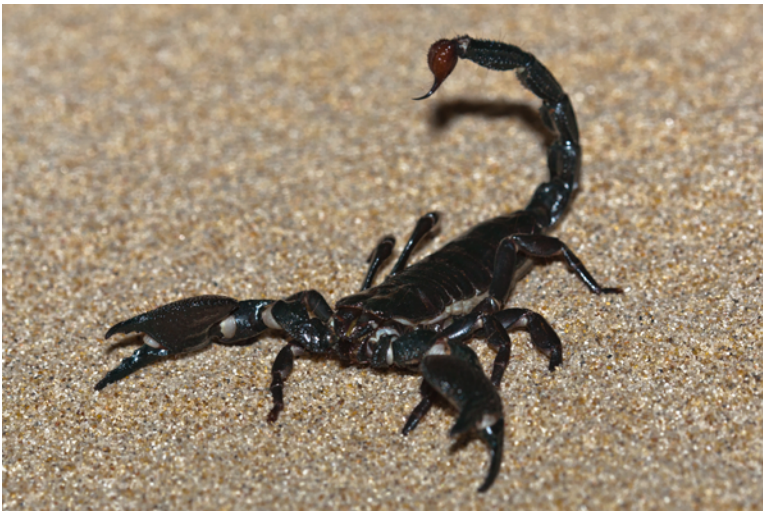
Tekst: K. Åström, Boken om världen. 2001.

يصطاد العقرب العناكب الكبيرة والحشرات الأخرى أثناء الليل. ويتحسّس العقرب طريقه بمساعدة مخالبه ويمسك فريسته بها ثم يقتلها بإبرته السامة.