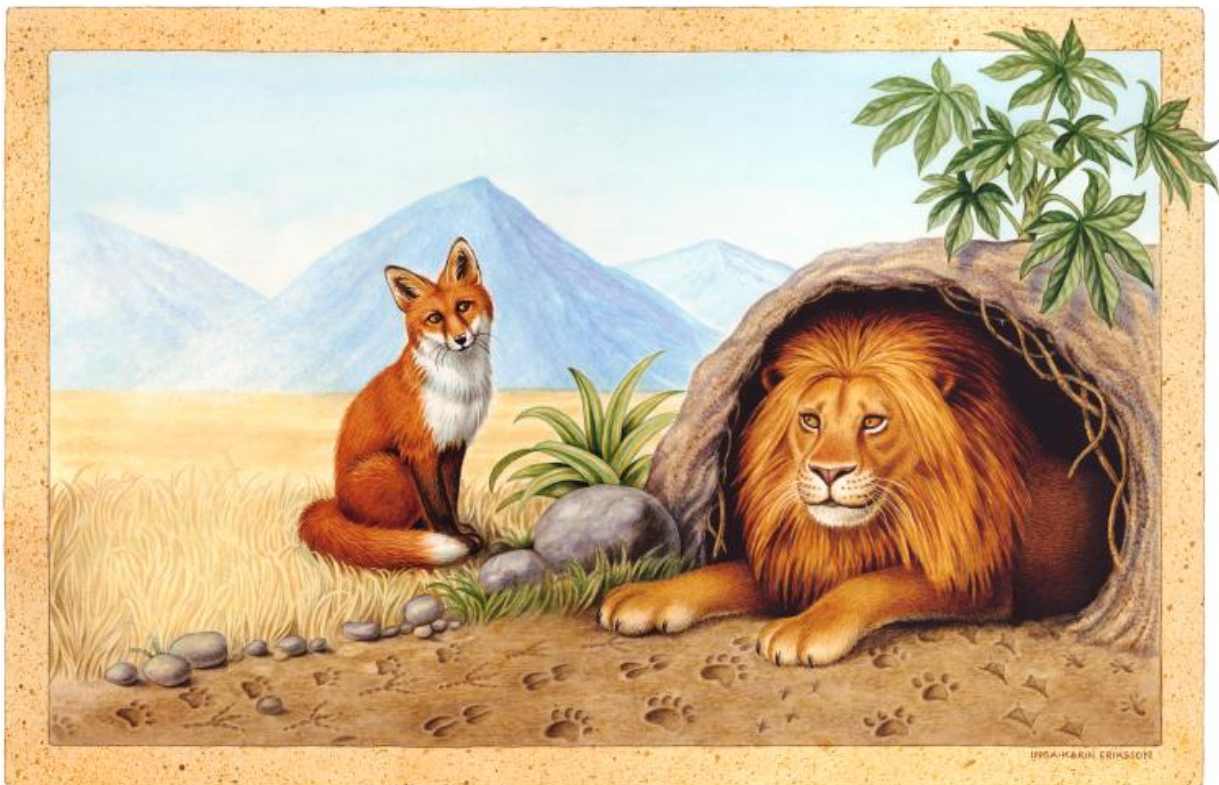
Billede: I-K. Eriksson. Tekst: K. Aronsson & S. Ottosson, Min läsebok. 1993. Bearbejdet.

But the fox did not go in. The lion asked the fox with a soft voice, "Why won't you come in, my friend? All the others have been here." "I was going to", said the fox, "but I saw the tracks and became frightened. All the tracks go into your den but none come out. That's why I think I'll stay out here."