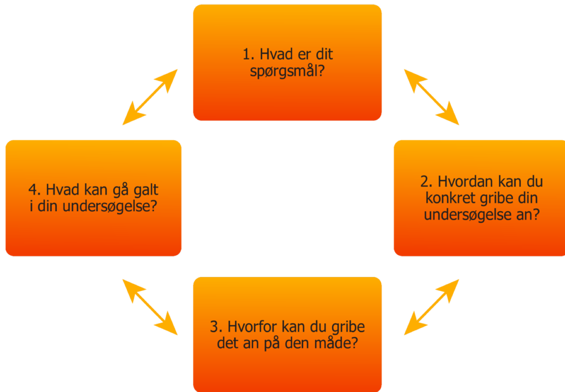
Figur: Den videnskabelige basismodel