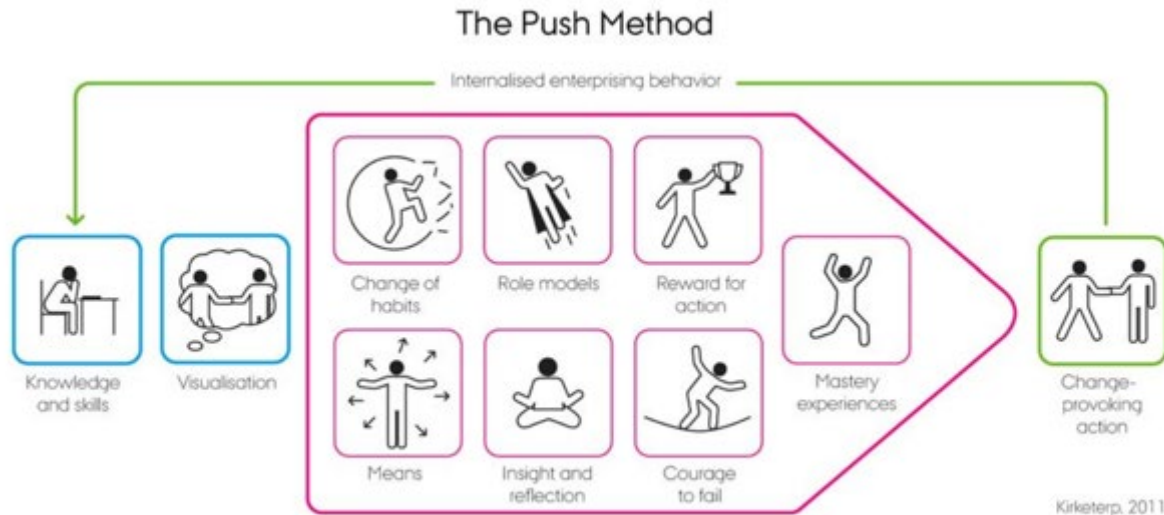
Figure 2: The push method – transforming thoughts into action

TES is one of the largest entrepreneurship education initiatives in Europe , co-funded by the European Commission through the Competitiveness and Innovation Programme (CIP). It aims at supporting teachers professional development in applying the entrepreneurial learning in several subjects and learning environments (primary, secondary, upper secondary and vocational schools).