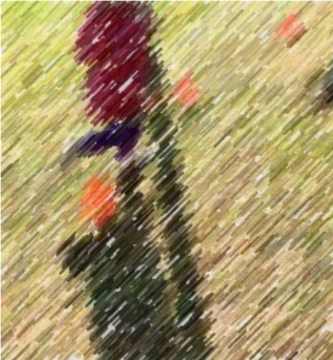
3 - Her er kegler, som de skal løbe igennem, fra side til side.