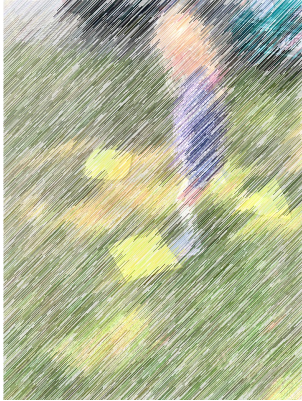
5 - Vi legede "jorden er giftig" med nogle gule felter, som vi havde klippet ud.