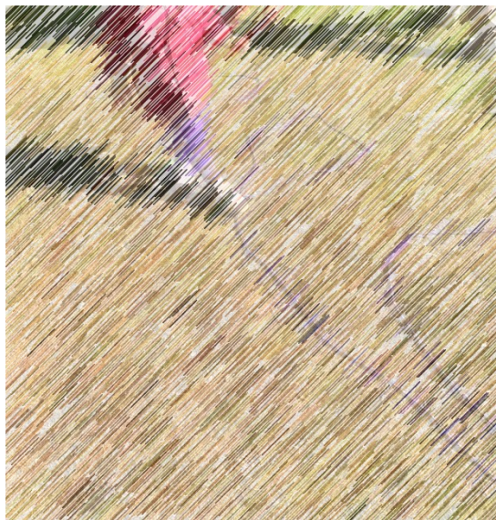
2 - Først valgte vi børnene skulle gå på line

Det skulle være udenfor, så det var ikke et stort problem, da man kan tage det meste med ud. Det skulle tage 15 minutter, og det var lidt svært, da børnene var hurtige igennem banen, men heldigvis syntes de det var sjovt.