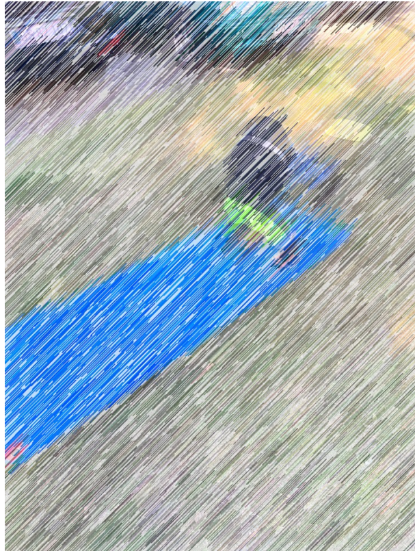
6 - Vi tog også en måtte med ud som de skulle slå kolbøtter på.