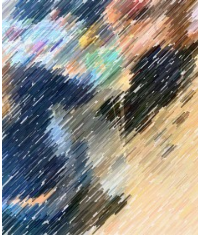
8 - Til sidst fik de guldmedaljer med OL ringe på, som vi også brugte ugen på at lave ud af trylledej.

Vi havde 15 minutter til banen, og børnene var for hurtige til at gennemføre banen. Så de prøvede banen mange gange, men de syntes det var sjovt. Men de fik trænet deres grov motorik, muskel/led- og balancesanserne, da de prøvede banen mange gange. Der var dog nogen som ikke ville være med, men vi motiverede de fleste af dem, til at være med alligevel. Så det gik faktisk rigtig godt, selvom banen tog 15 minutter at gennemføre.