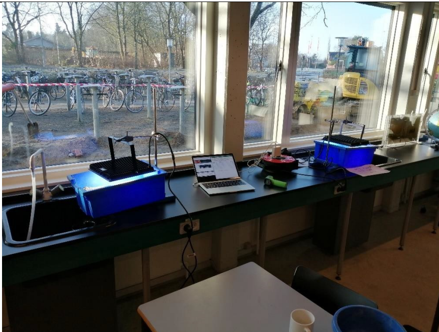
Bilag 2: Forsøgsopstilling med 2 isklumper.

Bilag 1: Eksempel på data, indsamlet af elever. Her blev kun brugt to isklumper, og eleverne forsøgte af måle overfladetemperaturen med et infrarødt termometer (kolonnen "Grader"), men opgav, da det var for svært at måle med håndholdt termometer.